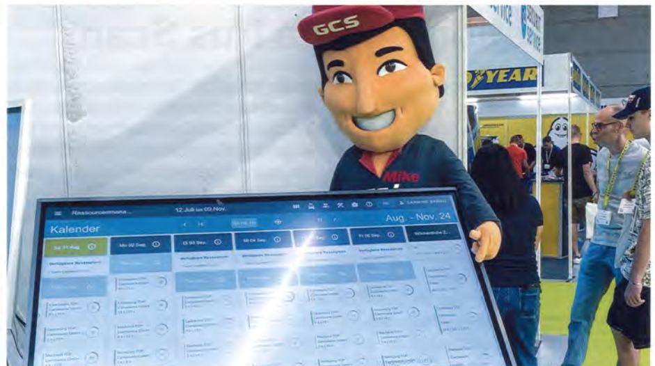
Mit dem Tool Digitalplanung hat man die Auslastung der Mitarbeitenden immer im Griff.

Einzigartig und erstmalig in der Schweiz ist die Vernetzung der Carrosserien mit Kunden, Flottenbesitzern, Versicherungen und Schadensteuern wie Yarowa möglich. Carrepnet