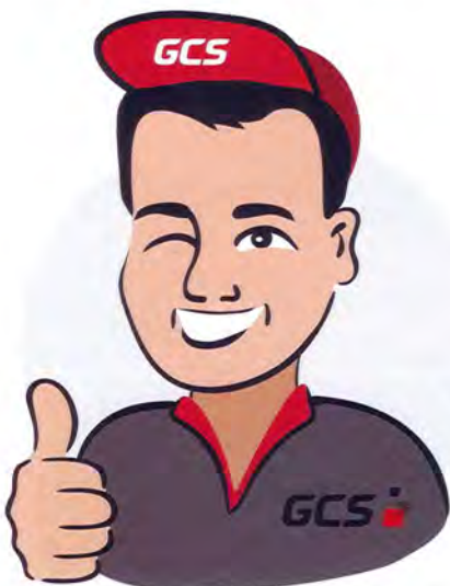
«Power auf Dauer», sagt Maskottchen Mike über die Lösungen von GCS Schweiz AG.

Im August 2022 fand das erste Gespräch mit der Führung der noimos ag statt. Als 100-prozentige Tochtergesellschaft der AXA verantwortet sie die digitalen Prozesse der AXA. Dabei konnten wir die Marktbedürfnisse mit den Bedürfnissen der AXA aufeinander abstimmen.