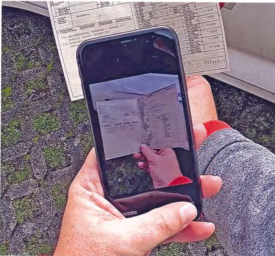
Mit dem exklusiven, KI-basierten Fahrzeugausweis-Scanner können Aufträge und Stammdaten einfach erfasst werden.

ginalen Auflösung. Wir sind so flexibel, dass wir den Media Manager einfach um neue Anforderungen erweitern können.